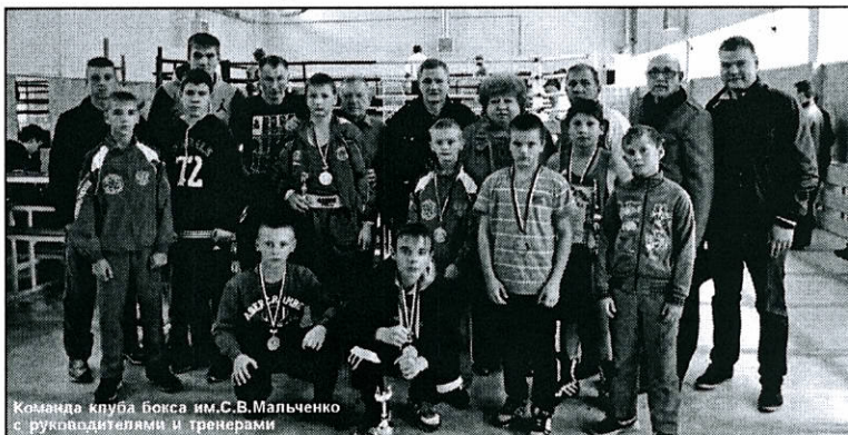
Команда клуба бокса им.С.В.Мальченко с руководителями и тренерами